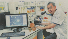
DR Sun mengemukakan pendapat.